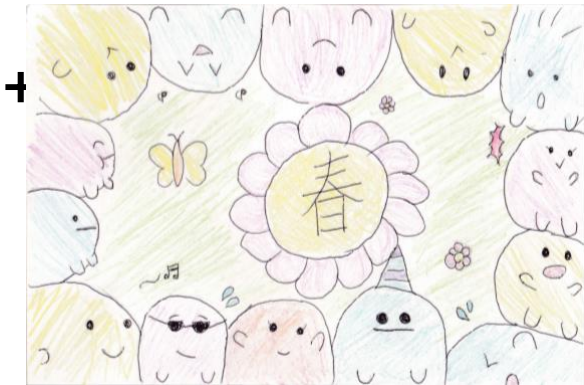
めぐみが丘子ども会 とかげさん

みなさん、お元気でしたか？ 3月からの急な休校期間、どのように過ごしたでしょうか。平子連だよりの98号クイズに葉書を送ってくれた方もいました。みなさんからの葉書は、ちゃんと届いています。役員さんがみなさんに平子連だよりを届けることは、大変だったと思います。そして、みなさんが郵便局へ葉書を買いに行くのもきっと大変だったと思います。そうして届いた葉書を1枚1枚、大切に見させていただきます。